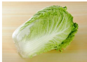
ミニハクサイづくりの ピンポイント追肥の裏ワザ