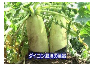
ダイコン栽培 1穴2本どりの方法